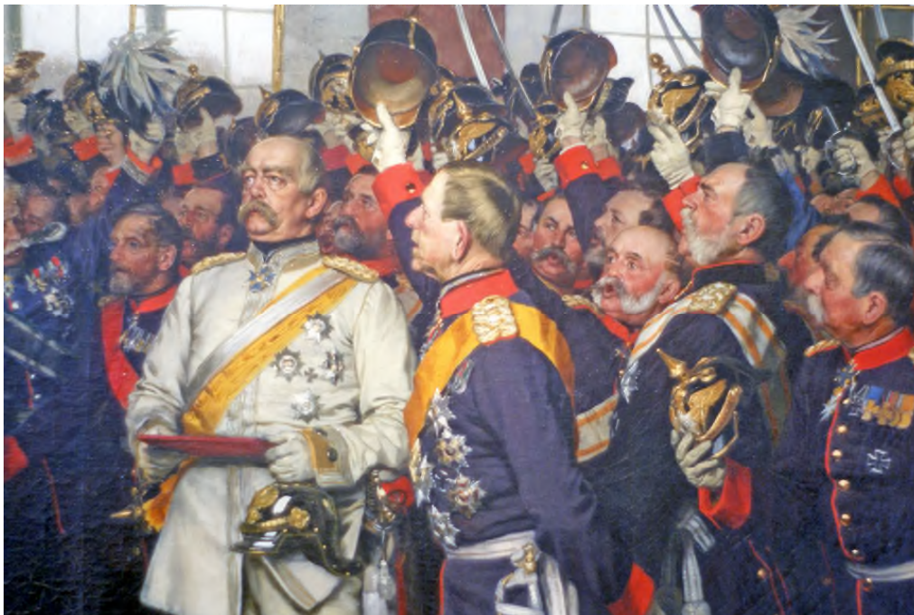
Fürst Otto von Bismarck in weißer Uniform auf dem Gemälde zur Kaiser-Proklamation, Friedrichsruh, Bismarck-Museum